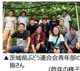
▲茨城県ぶどう連合会青年部の皆さん (昨年の様子)▶