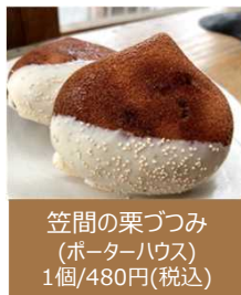
笠間の栗づつみ (ポーターハウス) 1個/480円(税込)

笠間稲荷神社や笠間焼で知られる笠間市。実は、 栗の産地としても有名 です！年間を通じた温暖な気候と、保水性や通気性に優れた火山灰土壌が 薫り高い栗を育み、日本一の栽培面積 を誇ります。今年で 4回目 となる『 笠間の栗フェア 』！生栗はもちろん、新たな商品を追加した 笠間の栗商品 を 期間限定 で販売いたします。22日(金)～24日(日)は 特別企画 を実施し、 市職員が店頭 に立ってPRを行います。(22日(金)には、 市長によるトップセールス を実施。)