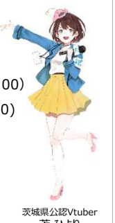
茨城県公認Vtuber 茨ひより