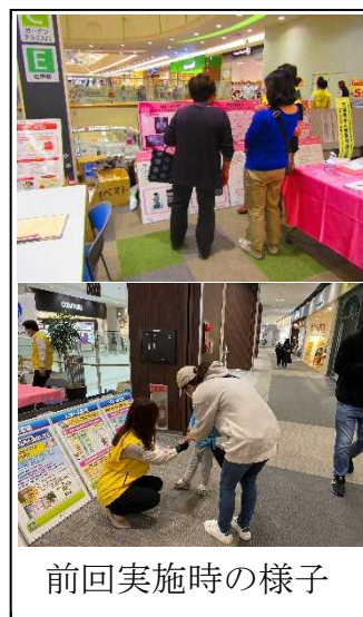
前回実施時の様子

公益社団法人茨城県診療放射線技師会が、放射線の種類やその影響等に関するパネル展示、乳がん検診を推進するピンクリボンのパネル展を実施します。