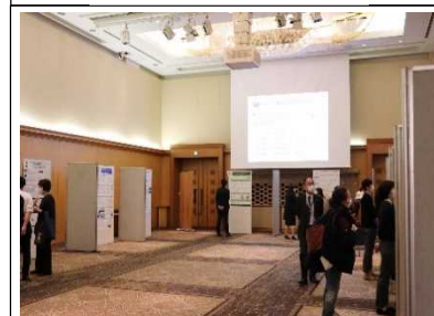
ポスター発表の様子