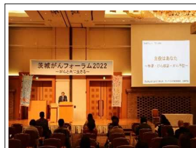
前回講演会の様子