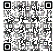
申し込み2次元バーコード

公益社団法人 認知症の人と家族の会 茨城県支部 住所 〒300-1292 茨城県牛久市中央3-15-1(牛久市保健センター隣) 電話 / FAX 029-828-8089 メールアドレス alz2010ibaraki@yahoo.co.jp ホームページ http://alzibaraki.starfree.jp