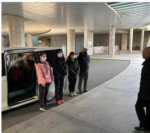
保健医療部次長からの激励のあいさつ