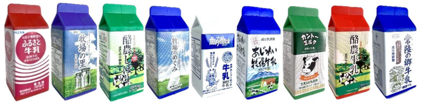
県産牛乳消しゴム（9種類）