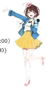
茨城県公認Vtuber 茨ひより