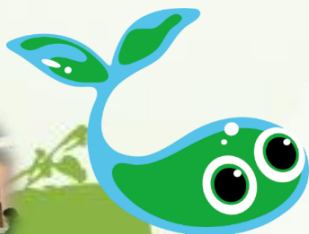
霞ヶ浦環境科学センター マスコット びゅあちゃん

○ご注意ください 来場者用駐車場は 土浦協同病院職員駐車場となります センターまでは無料シャトルバスで送迎します