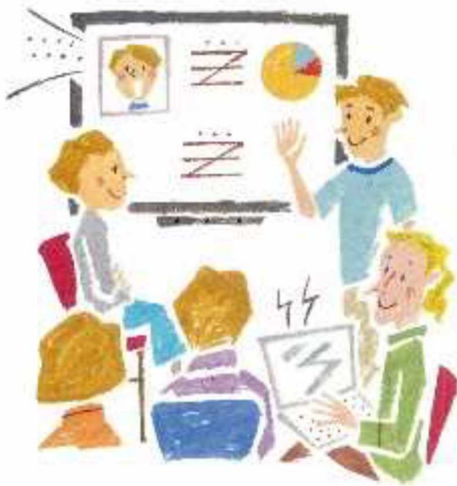
デジタル技術を活用した業務改革