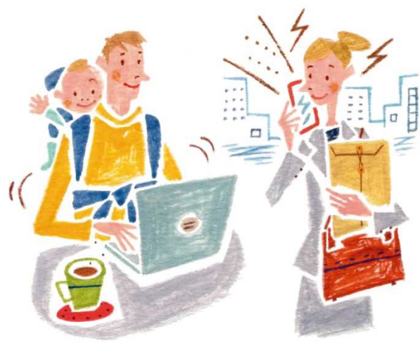
多様で柔軟な働き方の推進