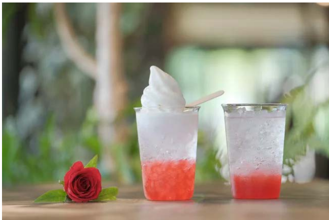
ローズファームカフェ バラのサイダー¥770 (フロート¥880)

エントランスに隣接したマーケット内にあるカフェでは、5月15日よりバラのサイダーを販売します。バラの時期だけ味わえる無農薬のバラを使ったサイダーには、濃厚な茨城牛乳のフロートのせもオススメ！美しい花々を楽しんだ後、味覚でも華やかなバラを味わってください。