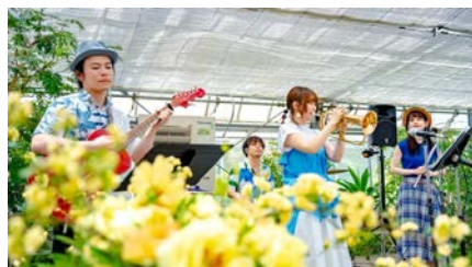
5月4日の公演の様子