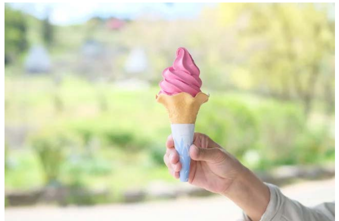
Yuit バラのソフトクリーム¥600