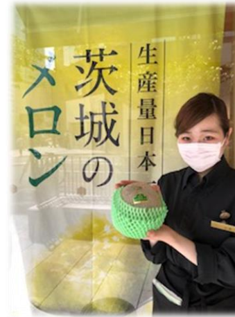
IBARAKI sense 吉澤

一年でいちばんさわやかなこの季節、イバラキセンス店前の桜並木も青々とした若葉に変わり、五月らしさがいっぱいです。店頭では これから本格的な旬を迎える「メロン」 が並んでおり、今後は初夏の茨城を代表する「新茶」「青梅」が登場する予定です。自然がいっぱいの茨城ならではの旬をイバラキセンスで感じてください。