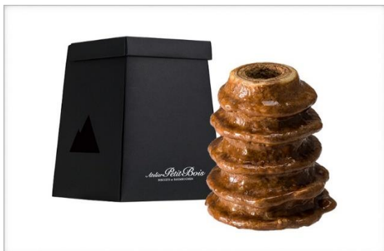
バウムクーヘン（ガトーアラブロッシュ）

その他、おみたんグッズやりんりんロードのノベルティなど豊富な景品をご用意しておりますので、ぜひお立ち寄りください。