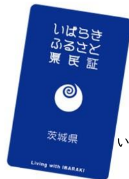
いばらきふるさと 県民証