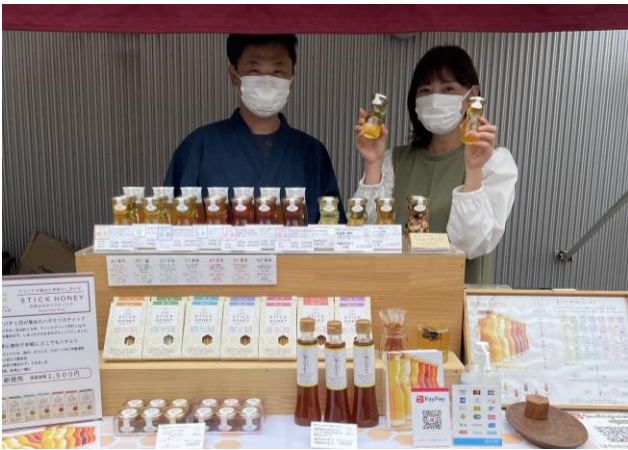
市町村ブース①(五霞町)