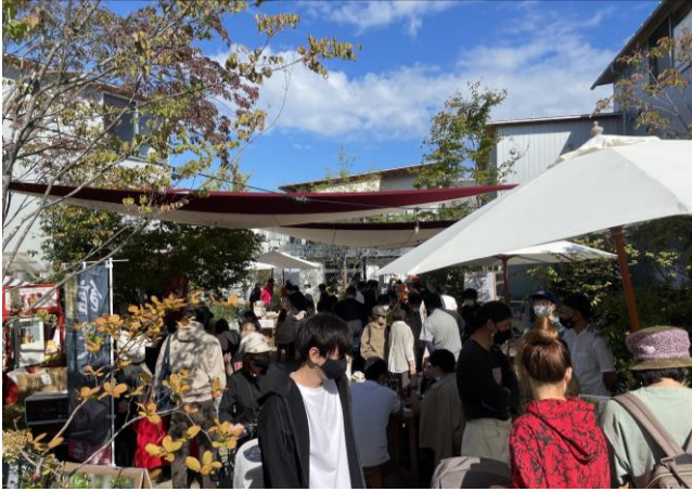
会場風景(下北沢側)