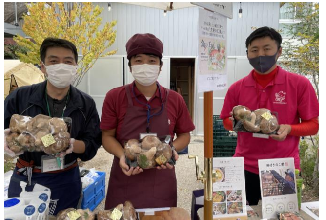
市町村ブース②(笠間市)