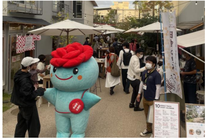
会場風景(世田谷代田側)