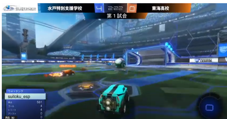
試合の様子（水戸特別支援学校 VS 東海高等学校）