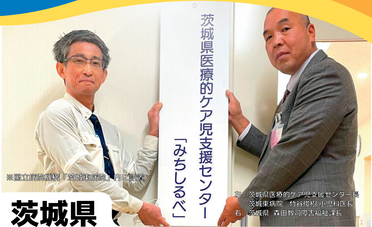
※国立病院機構「茨城東病院」内に設置