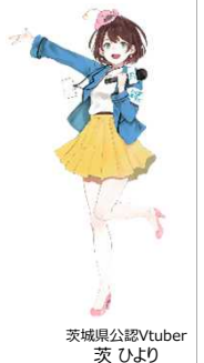
茨城県公認VTuber 茨ひより