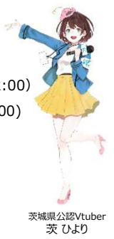
茨城県公認Vtuber 茨ひより