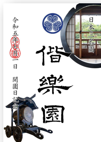
開園日記念カード