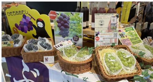
(昨年イベントの様子)

その他、IBARAKI senseのカフェやダイニングで、常陸太田市産のぶどうを提供します♪