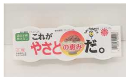
『これがやさとの恵みだ』 (やさと農業協同組合) 35g×3個/278円(税込)