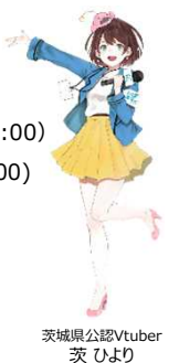
茨城県公認Vtuber 茨ひより