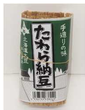
『たわら納豆』(杉本納豆店) 80g/300円(税込)