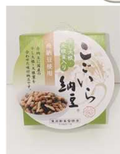
『こごいら納豆』(丸真食品株) 100g/370円(税込)