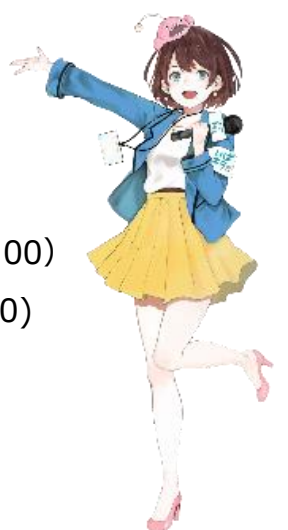
茨城県公認Vtuber 茨ひより