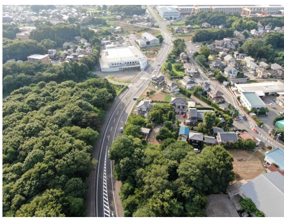
県道守谷藤代線バイパス完成区間