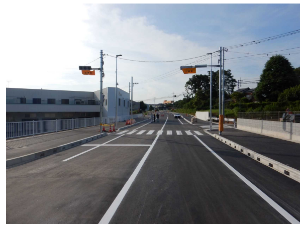
県道守谷藤代線バイパス完成区間