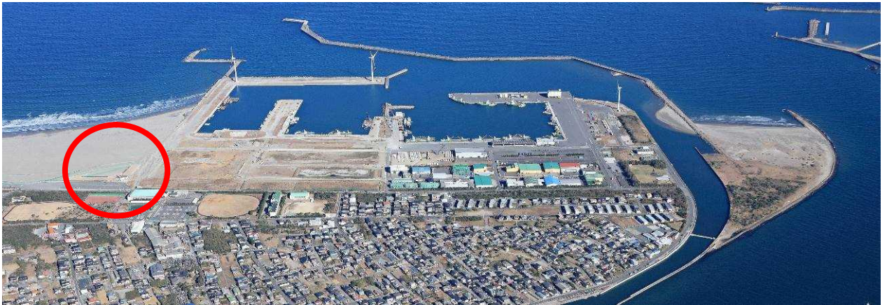
図1 波崎漁港海岸施設位置図