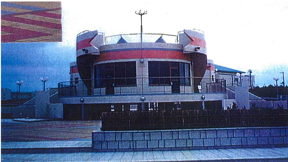
図2 波崎漁港海岸休憩施設外観