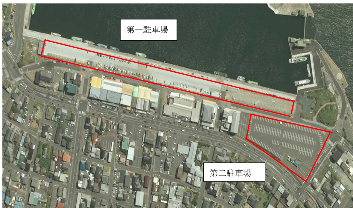
図 那珂湊漁港駐車場全景