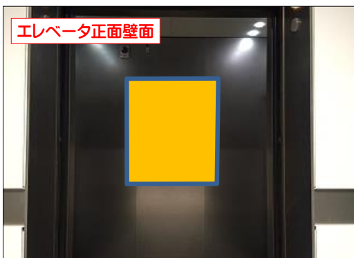
エレベータ正面壁面