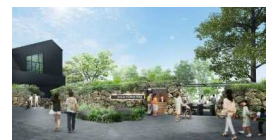
茨城県フラワーパーク エントランス (リニューアル後イメージ)