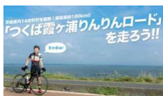
つくば霞ヶ浦りんりんロード