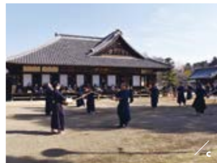
a. 大洗神矶鸟居 / 矶前神社【大洗町】 b. 日本近代美术界的泰山北斗 - 冈仓天心所设计的建筑物 / 六角堂【北茨城市】 c. 江户时代的综合大学 / 弘道馆【水户市】 d. 本殿 / 鹿岛神宫【鹿岛市】 e. 被禊 / 下馆祇园祭【筑西市】 f. 紫藤花的花期在5月初旬 / 笠间稻荷神社【笠间市】 g. 6月份的时候举办潮来菖蒲花祭时，可以看到潮来传统的出嫁风俗，还可以欣赏到菖蒲花盛开的风姿 / 水乡潮来菖蒲花祭【潮来市】