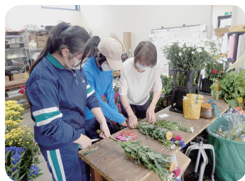
ジュニア技能インターンシップ (フラワー装飾)