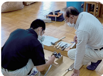
ものづくりマイスターの活動 (技能講習会)