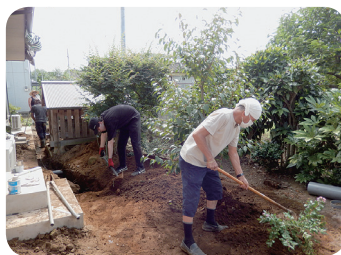
ジュニア技能インターンシップ (建築配管)