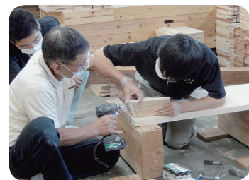
ジュニア技能インターンシップ (建築大工)