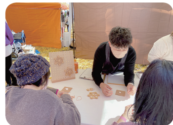
ものづくりマイスターの活動 (ものづくり教室・ものづくり体験教室)