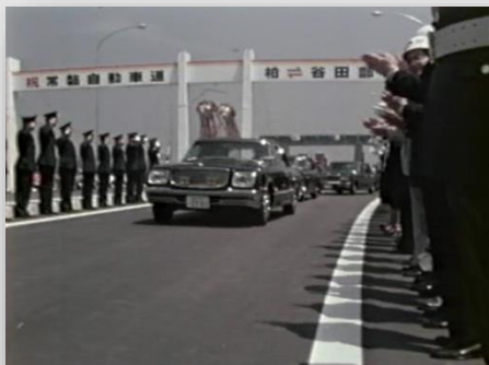
常磐自動車道柏—谷田部開通