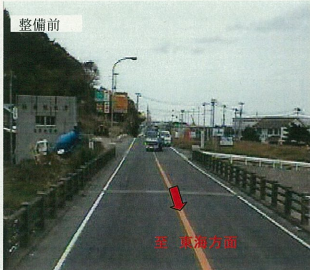
平成15年度 新茂宮橋から日立方向

一般国道245号 新茂宮橋(日立市久慈町) 平成23年10月31日に4車線(L=480m)供用開始しました。