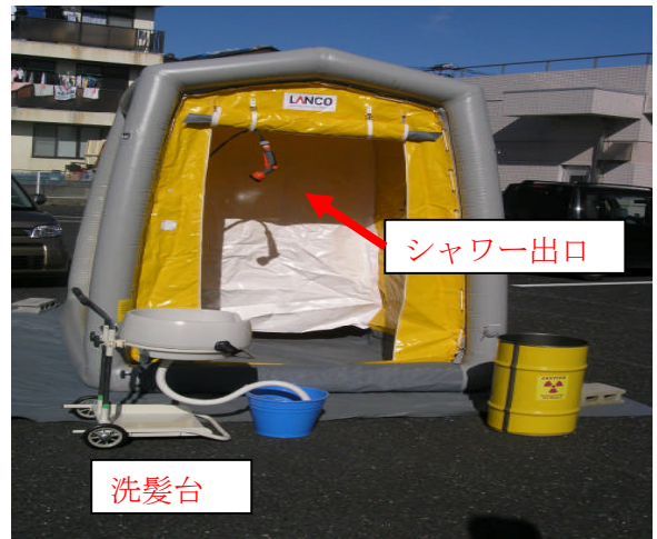
◎シャワーテントの全体像 手前（シャワー室）・奥（更衣室）