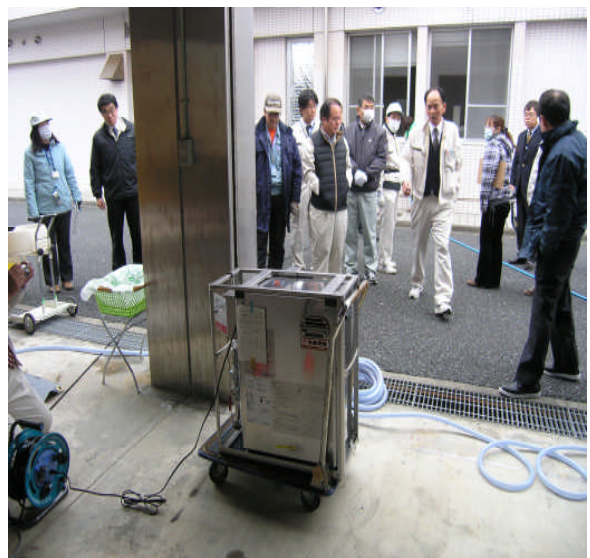
◎長いホースを水道水（消火栓等）へ 短いホースはテント（注入口）へ接続 する。