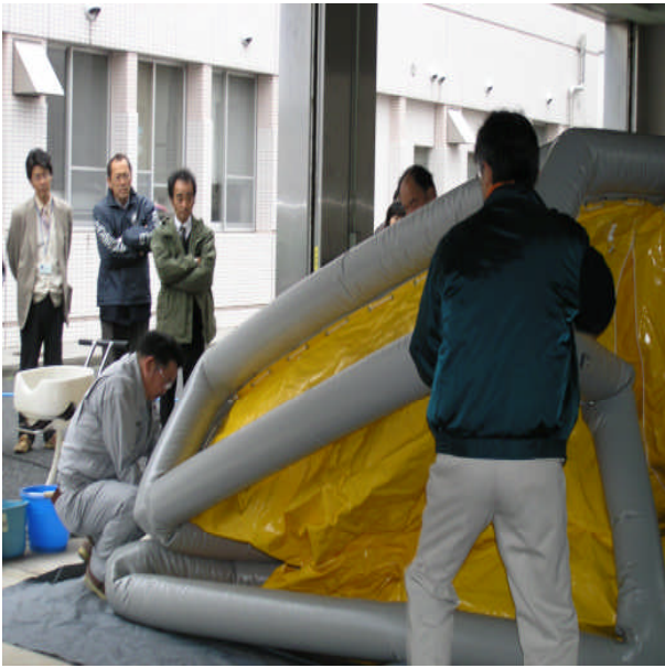
◎エア注入後約5分間で立ち上げ可能