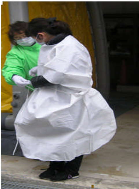
◎ プライバシーキット 全身除染後、着替えまで使用する。