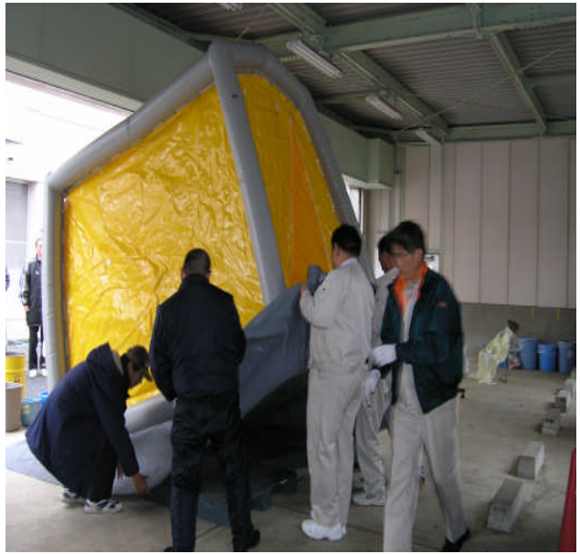
◎非汚染区域に汚染水が入らないように段差を付ける。汚染区域の汚染水はポンプで汚染水回収水槽へくみ出す。