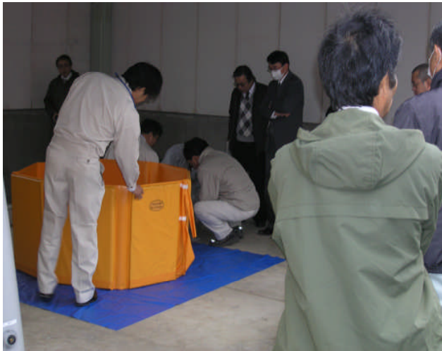
◎ 温水回収水槽は上部を専用金具で固定する。