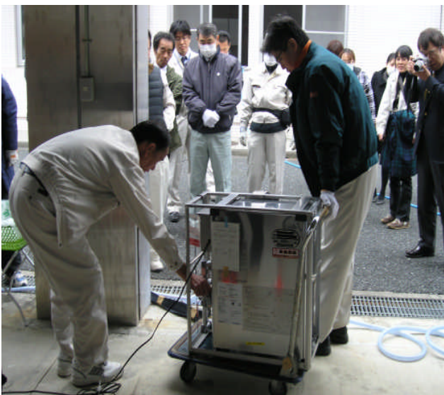
◎温水器の燃料は灯油を使用する。 専用バルブを開放して、エア抜きを行い、