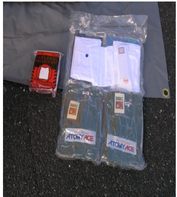
◎更衣用スポーツジャージ 冬季用にジャンパーの配備が望まれる。