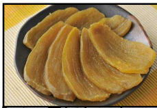
「べっ甲ほしいも」 株式会社幸田商店

幸田商店の独自の技術により、べっ甲色に輝く高品質な干し芋を創り上げました。 サツマイモの希少品種である「いづみ種」を限定使用しているため、特有のねっとりとした深い甘味と、食感が味わえます。