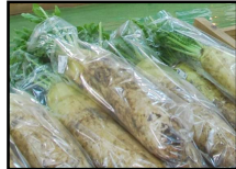
つくばみらい市 大根