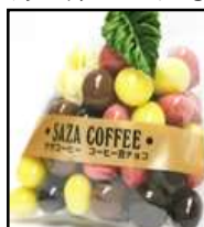
「コーヒー豆チョコ」 株式会社サザコーヒー

ふんわりしっとりのスポンジで生クリームと常陸大黒を巻きました。どこを切っても常陸大黒が出てくるほど、たっぷり使用しています。 希少価値の高い常陸大黒とは、全国初の黒一色の花豆のことです。日本一大きな黒豆でもあり、茨城県の県北地方（大子町、旧里美村など）でしか栽培できません。