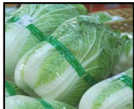
八千代町、坂東市産 白菜

取扱商品一例：白菜、大根、ブロッコリー、生しいたけ、お米、イチゴ、シクラメンなど