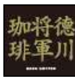
「徳川将軍コーヒー」 株式会社サザコーヒー

幸田商店の独自の技術により、べっ甲色に輝く高品質な干し芋を創り上げました。 サツマイモの希少品種である「いづみ種」を限定使用しているため、特有のねっとりとした深い甘味と、食感が味わえます。