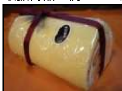
「大黒ロール」 大子製菓協業組合

ふんわりしっとりのスポンジで生クリームと常陸大黒を巻きました。どこを切っても常陸大黒が出てくるほど、たっぷり使用しています。 希少価値の高い常陸大黒とは、全国初の黒一色の花豆のことです。日本一大きな黒豆でもあり、茨城県の県北地方（大子町、旧里美村など）でしか栽培できません。