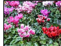
坂東市 ガーデンシクラメン