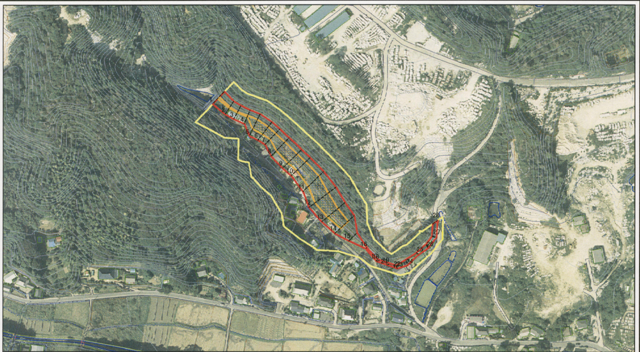
図中の数字は横断測線番号を示す