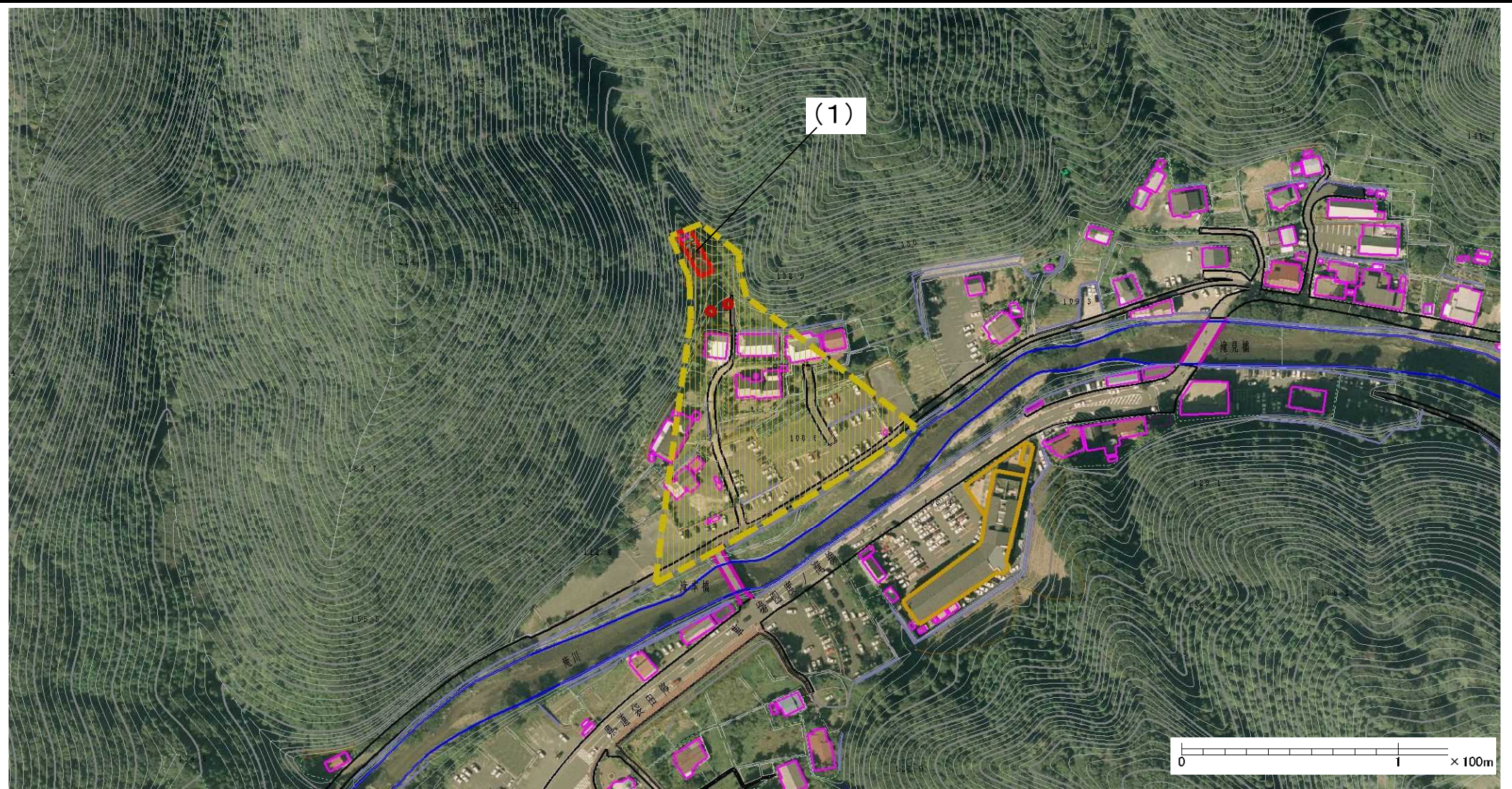
様式-2(土) 土砂災害警戒区域・土砂災害特別警戒区域 区域図(その1)