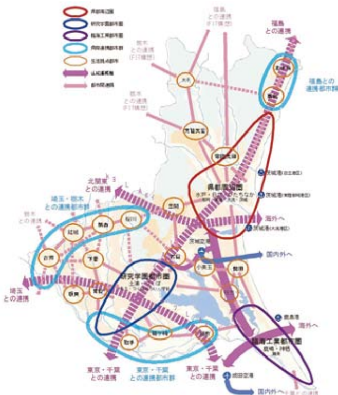
図2 都市・地域と広域連携ネットワーク