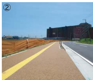
遮熱性舗装(島名環状線)