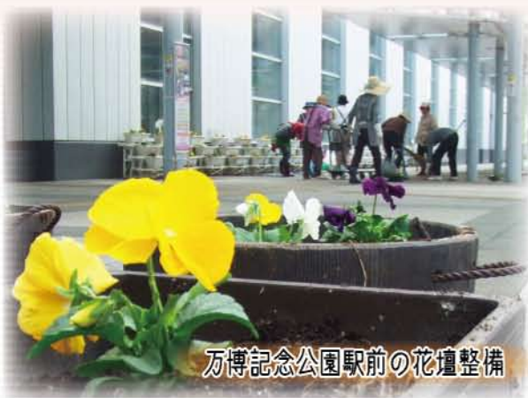
万博記念公園駅前の花壇整備