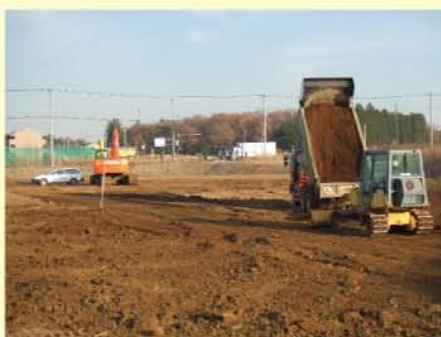
③一次造成工事の様子(E街区)