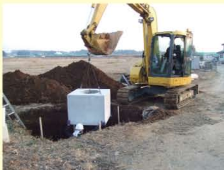
①土浦坂東線バイパスの道路工事の様子