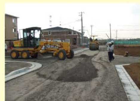
④二次造成工事の様子(F街区)