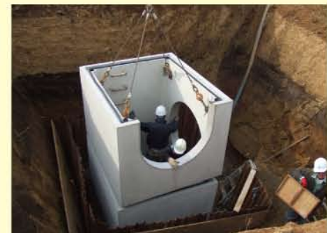
②下水道工事の様子(E街区)