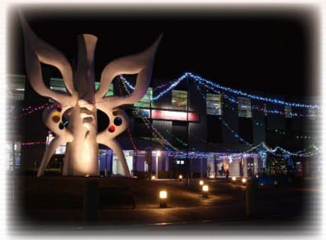
万博記念公園駅東口駅前広場の様子