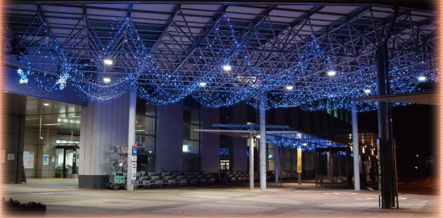
万博記念公園駅西口イルミネーション