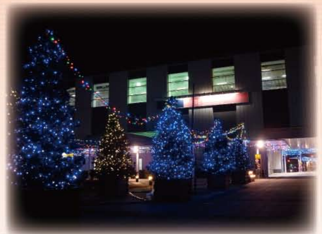
万博記念公園駅東口イルミネーション