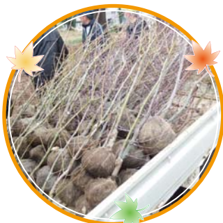
トラックいっぱいのもみじの苗木75本!!

添え木をしたり、水をかけたり、大変な作業でしたが、終わったら達成感で満ち溢れた姿を見せてくれました。