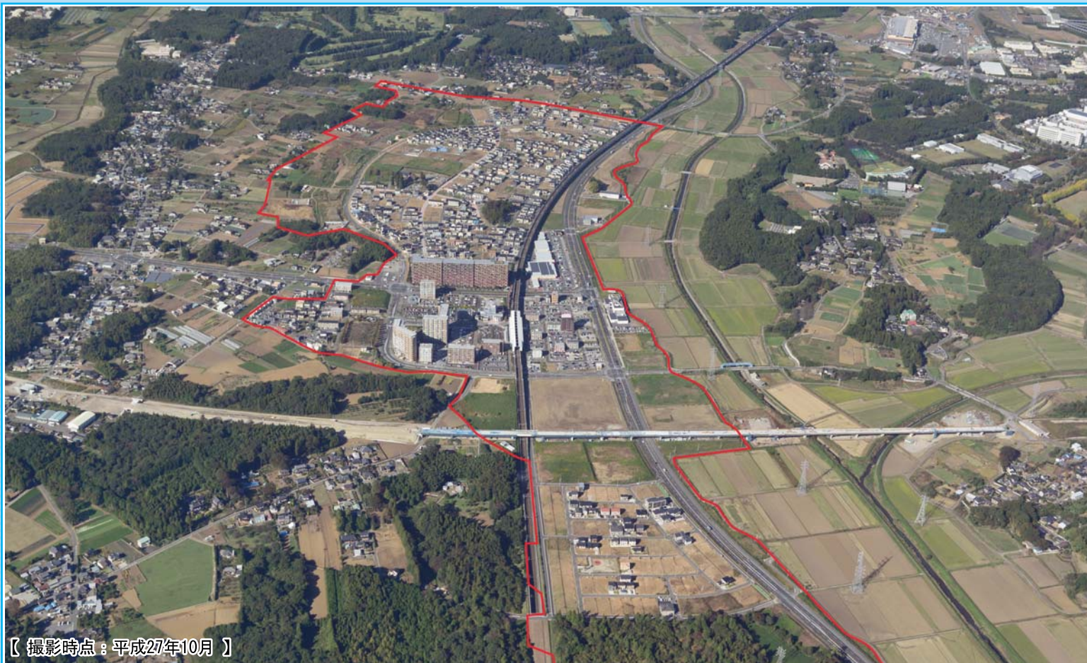
【撮影時点：平成27年10月】