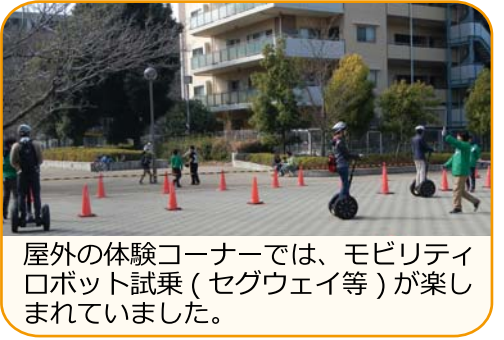
屋外の体験コーナーでは、モビリティロボット試乗(セグウェイ等)が楽しまれていました。