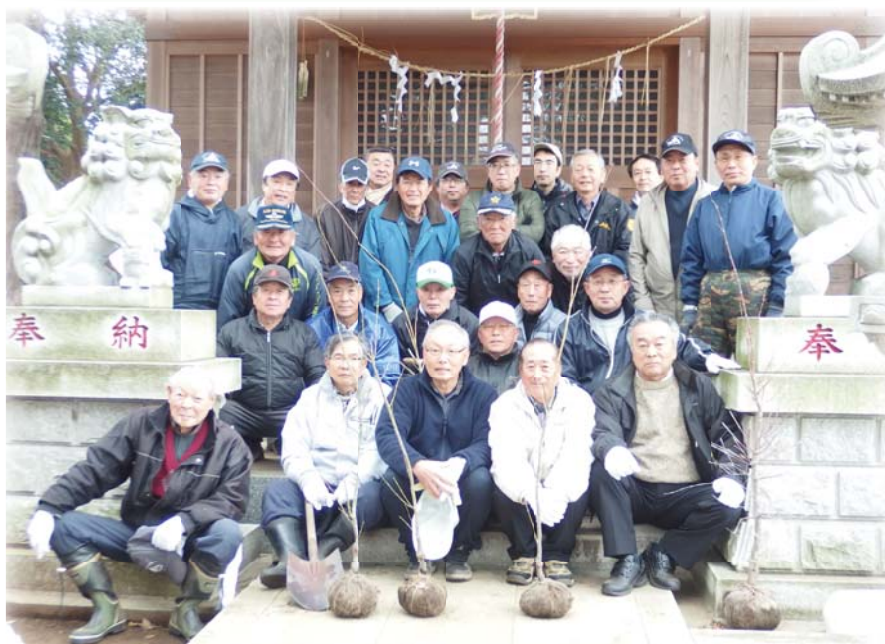
島名地区まちづくり協議会を中心とした植樹事業が、平成28年3月13日（日）に島名地区の香取神社で行われました。（詳細はp4へ）

「田園都市島名を緑と花の息づくまちにしたい」 ～みんな想いの下に集まった仲間たち～