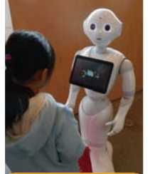
アンケートをとる Pepper(ペッパー)

また、今回がつくば市での初開催となる“ロボワン”やG7各国のロボットたちが勢ぞろいし、多くの人で賑わいました。