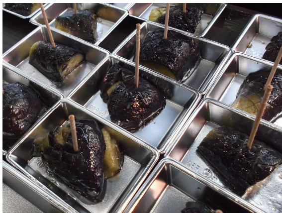
なすの煮浸しの試食