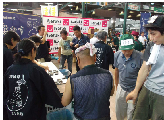
なすは夏にピッタリの食材です