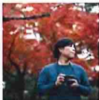
東京カメラ部10選