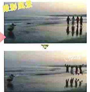
なるべく低い位置から撮影をすると、うまくリフレクションして綺麗に撮影ができます。