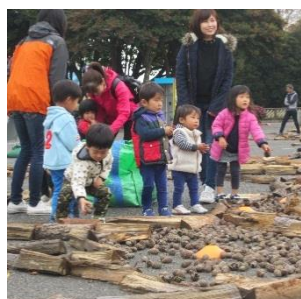
「みんなでアート」巨大地上絵をつくろうの様子