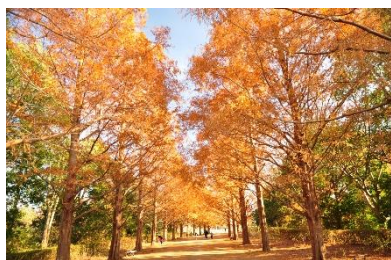
メタセコイア(紅葉) 12月上旬 メタセコイアの並木道