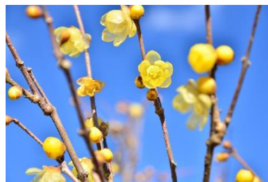
ロウバイ 12月下旬~1月下旬 みはらしの里入口