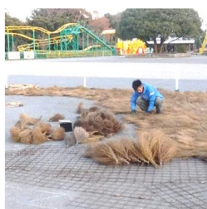
干支の巨大地上絵制作風景

冬の本公園では、心も体も温まる楽しみ方が盛り沢山！「ぽっかぽか冬フェア!!」期間中は、冬に咲くアイスチューリップなどの草花、干支の巨大地上絵や古民家でのお正月行事など、寒い時期でも外で遊びたくなる様々なイベントが目白押し。「みんなでアート」巨大地上絵をつくろうでは、来園された方に松ぼっくりを入れてもらい、巨大地上絵を完成させます。ぜひ公園で、ホッとあたたまる体験や風景をお楽しみください。