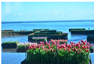
アイスチューリップ 12月下旬~1月上旬 グラスハウス