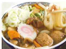
〈筑波山名物つくばうどん〉

筑波山地域ジオパークを食とツアーで楽しむ【会場内】 『筑波山地域ジオパークの日』開催! 開催日: 2月22日(土)・23日(日)