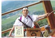
〈ガマの油売り口上〉