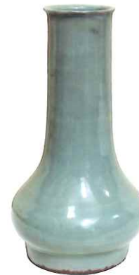
青磁蕪形瓶 遊行寺宝物館