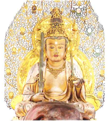
国指定重要文化財 釈迦如来および両脇侍坐像 浜松市・方広寺