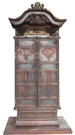
月溪妙清御影堂 個人