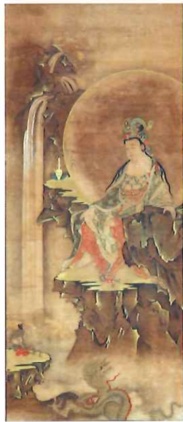
茨城県指定文化財 滝見観音図 常陸太田市・正覚寺 展示三月八日～三月一日