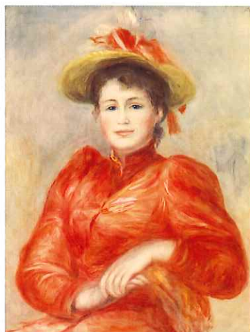
▲ピエール＝オーギュスト・ルノワール「赤い服の女」1892年頃