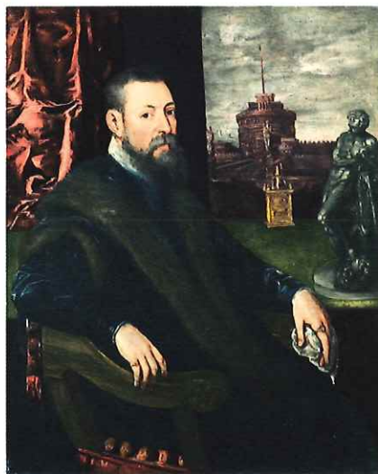
ティントレット(ヤコポ・ロブステイ)「蒐集家の肖像」1560-65年