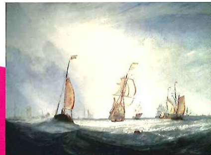
ジョセフ・マラード・ウィリアム・ターナー 「ハレワーズ・ブリッジから見たセント・ピートル・リバー」1832年