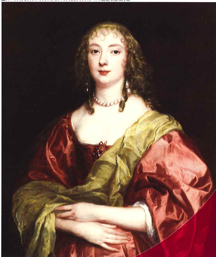
▲アントニー・ヴァン・ダイク「ベッドフォード伯爵夫人 アン・カーの肖像」(部分) 1639年