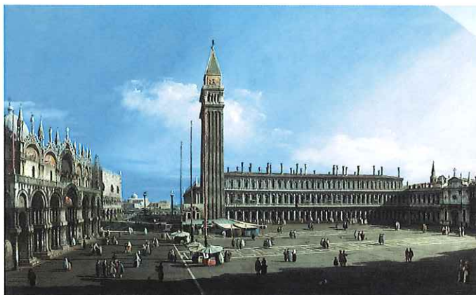
▲カナレット (ジョヴァンニ・アントニオ・カナル)「ヴェネツィア、サンマルコ広場」1732-33年頃