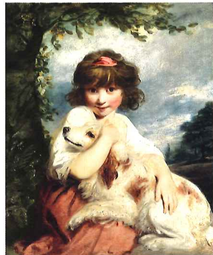
ジョシュア・レノルズ「少女と犬」1780年頃