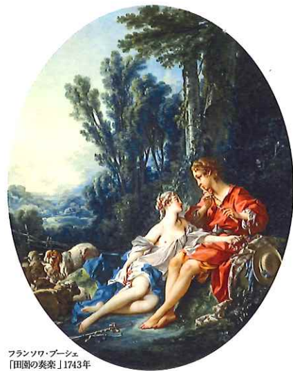
フランソワ・ハルセ 「四重奏」1743年