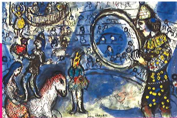
マルク・シャガール「曲馬」1967年 ©ADAGP, Paris & JASPAR, Tokyo, 2019, Chagall® C3110