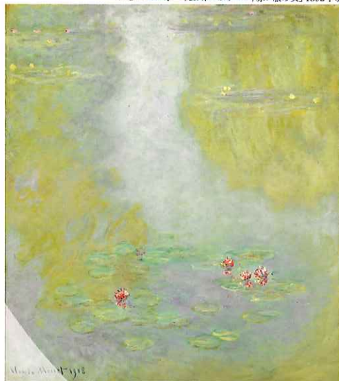
▲クロード・モネ「睡蓮」1908年

◆主催:茨城県近代美術館 ◆後援:水戸市/NHK水戸放送局/ 朝日新聞水戸総局/茨城新聞社/産経 新聞社水戸支局/東京新聞水戸支局/日本 経済新聞社水戸支局/毎日新聞水戸支局/読売 新聞水戸支局 ◆協賛:株式会社常陽銀行/茨城交通株式 会社/光村印刷 ◆協力:ヤマトグローバルロジスティクスジャパン ◆開館時間:午前9時30分～午後5時(入場は午後4時30分まで) ◆休館日:3月 30日(月)、4月6日(月) ※水戸の梅まつりにあわせて会期中3月29日までは無休 ◆入場料:一般 1,100(1,000)円/満70歳以上550(500)円/高大生870(730)円/小中生490(370)円 ※( )内は20名以上の団体料金 ※障害者手帳等をご持参の方は無料、高校生以下は春休み期間を除く土曜日のみ無料