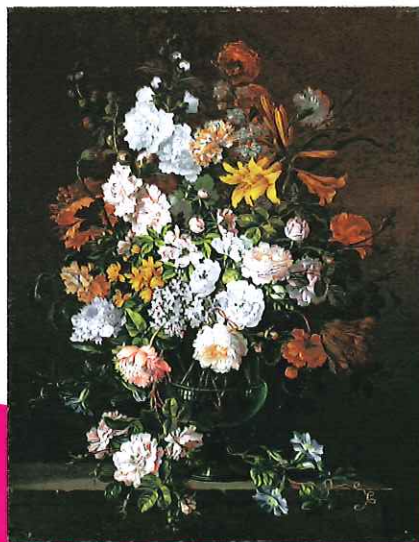
ジャン・バン・ホイイスト「花」17世紀