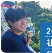
20代 社会人 徳島県