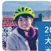
20代 大学生 東京都