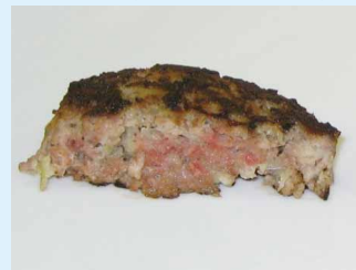
ハンバーグ(火が通っていない)