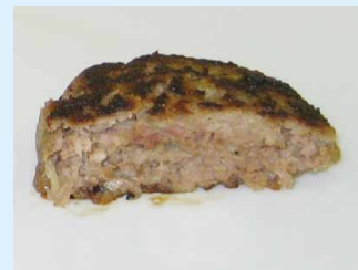
ハンバーグ(火が通っている)