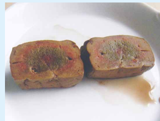
レバー(火が通っていない)