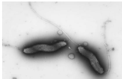
カンピロバクターの電子顕微鏡写真