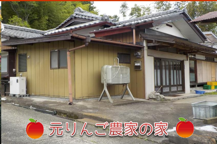
元りんご農家の家