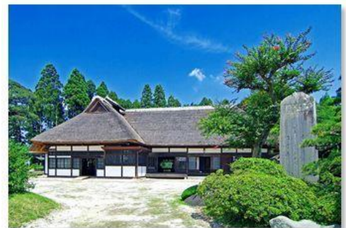
県指定文化財「穂積家住宅」