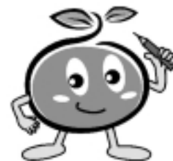
2005年農林業センサス