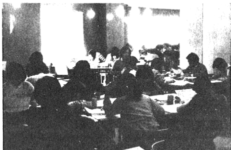
1980年 世界農林業センサス 審査風景

本誌3月号で昭和55年国勢調査の計画概要を紹介しましたが、調査項目が正式に決定しました。その内容は、3月号で紹介したとおり22項目です。4月1日には茨城県実施本部も設置され、10月1日に向けて本格的な胎動がはじまります。