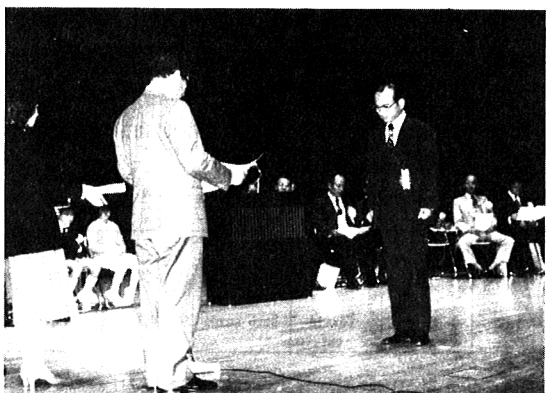
各省庁大臣表彰伝達