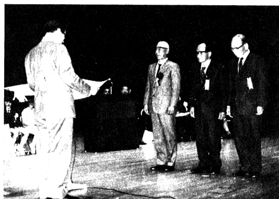
県統計協会総裁表彰