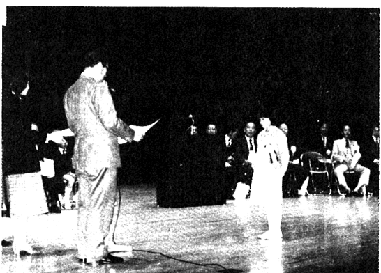
グラフコンクール知事賞表彰