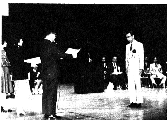
全統連会長表彰伝達