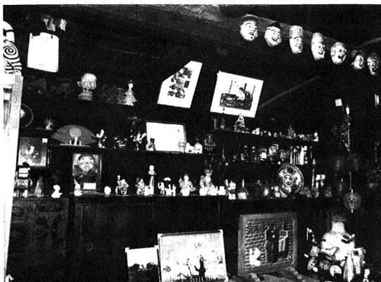
福島三春町デコ屋敷